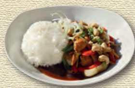
42 Chow Chicken • 7,90 € Gebratenes Hähnchenfleisch mit verschiedenem Gemüse und Cashewkernen 1)