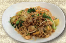
38 Bratnudeln Fernost • 9,90 € Breite Reismudeln mit Hähnchenfleisch, Garnelen, Paprika und Pak Choi in pikanter Austernsauce 1)