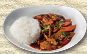
41 Chicken Gumbo (scharf) • 7,90 € Gebratenes Hähnchenfleisch mit Gemüse und Knoblauchsauce 1)