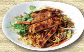
32 Bratnudeln mit gegrilltem Chicken Teriyaki • 7,90 € 1)