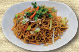
31 Bratnudeln mit verschiedenem Gemüse • 6,50 € 1)