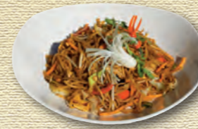
35 Vegetarische Bratnudeln mit Tofu • 7,50 € Frische, hausgemachte Eiernudeln mit Pak Choi, Tofu, Sojasprossen und ausgewähltem Gemüse 1)