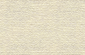
57 Gebratenes Gemüse • 7,50 € mit Tofu und Reis 1)