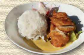
45 Knusprige Hähnchenbrust (scharf) • 8,20 € mit Thaicurry und roter Curry-Kokos-Sauce 2)