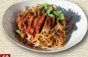
52 Ente Teriyaki • 9,90 € Bratnudeln mit Gemüse und knuspriger Ente Teriyaki 1)