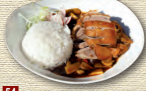
54 Knusprige Ente • 9,90 € mit Gemüse und pikanter Sojasauce 1)