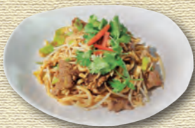
39 Yaki Udon • 9,50 € Gebratene Udon Nudeln mit Rindfleisch, Ei, Lauch, Sojasprossen, Chili und Knoblauch (scharf) 1)