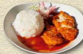
43 Knusprige Hähnchenbrust • 8,20 € mit Ananas und süß-saurer Sauce