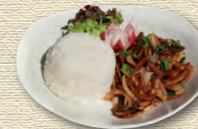
46 Rindfleisch nach Vietnam Art (scharf) • 8,90 € Mariniert in Chili und Zitronengras, gebraten mit Zwiebeln und Lauch 1)