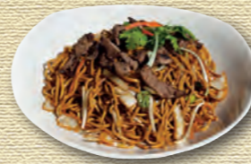
34 Bratnudeln mit gegrilltem Rindfleisch (scharf) • 8,90 € mariniert in Zitronengras und Chili 1)