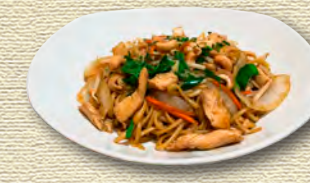
37 Kantonesische Bratnudeln • 9,50 € Frische, hausgemachte Eiernudeln im Wok gebraten, Hähnchenfleisch, Gemüse, in scharfer Sauce mit gerösteten Cashewnüssen 1)