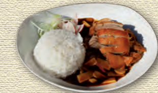
51 Knusprige Ente • 9,90 € mit Wok-Gemüse in Austernsauce