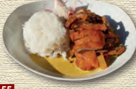
55 Knusprige Ente (scharf) • 9,90 € mit Thaicurry und roter Curry-Kokos-Sauce 2)