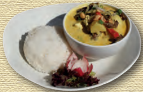
24 Massaman Beef (scharf) • 8,90 € Rindfleisch in Massaman-Curry mit Kokosmilch, Paprika, Kartoffeln, Zwiebeln und Erdnüssen, dazu Duftreis 2)