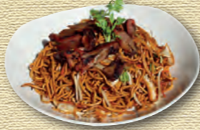
33 Bratnudeln mit gegrilltem BBQ Pork (Schwein) • 8,90 € 1)3)