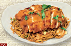
56 Knusprige Hähnchenbrust • 8,90 € mit gebratenen Nudeln

für Informationen zu Allergenen sprechen Sie gerne unsere Mitarbeiter an