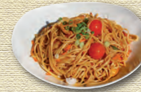
36 Malaysische Bratnudeln • 9,50 € Frische, hausgemachte Eiernudeln mit Putenbruststreifen und Gemüse in pikanter Curry-Tomatensauce, mit Knoblauch