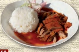
53 Knusprige Ente • 9,90 € mit Ananas und süß-saurer Sauce