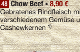
48 Chow Beef • 8,90 € Gebratenes Rindfleisch mit verschiedenem Gemüse und Cashewkernen 1)